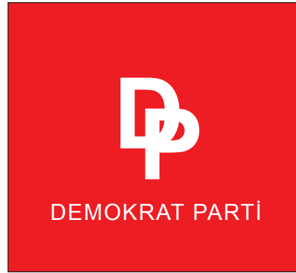
Şekil 2: Demokrat Parti Amblemi.