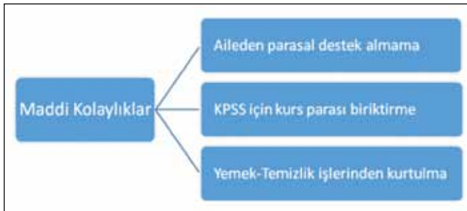
Şekil 3: Maddi kolaylıklar algısı.

Maddi Kolaylıklar: Katılımcıların aile faktörü içinde yoğun olarak vurguladıkları ikinci alt neden, Farabi Değişim Programı ile elde edilecek maddi kolaylıklar olmuştur. Programın sağladığı maddi kolaylık, katılımcılar tarafından üç boyutta değerlendirilmektedir (Şekil 3): Bunlardan biri, ailenin yanında kalarak barınma, yeme, içme gibi ihtiyaçların maddi yükünden kurtulmaktır. İkinci boyut ise değişim programının sağladığı burs imkânından yararlanarak, KPSS için kurs parası biriktirme anlamını taşımaktadır. Diğer ise yemek pişirme, temizlik gibi kişiyi yoran ve zaman kaybına neden olan sorunlardan uzaklaşmaktır.