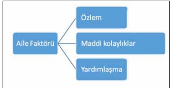
Şekil 2: 'Aile' faktörünü oluşturan alt nedenler.

Katılımcıların aile faktörü nedeniyle Farabi Öğrenci Değişim Programı'ndan yararlanmak istemelerinin altında, "özlem", "maddi kolaylıklar" ve "yardımlaşma" olmak üzere üç alt nedenin yattığı görülmüştür (Şekil 2). Alt nedenlere ilişkin bulgular katılımcı ifadeleri ile birlikte aşağıda verilmiştir.