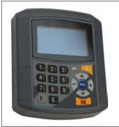
Şekil 2: Sınıf kapılarına yerleştirilmiş olan "mifare" kart okuyucu.

Her sınıfın kapısında, özel oluşturulmuş alanlara yerleştirilmiş vaziyette Şekil 2'deki "mifare" kart okuyucuları bulunmaktadır. Öğretim elemanı kartını okutarak sınıf kapısının açılmasını sağlar ve yoklamayı başlatır. Aktif olan yoklama sonrası öğrencilerin kimliklerini okutması ile yoklama bilgileri, veri tabanı sunucusuna gönderilir. Şekil 3'de yoklama işleminin başlatılması ve çalışması ile ilgili sürecin akış şeması yer almaktadır. Farklı bir "web" sunucusu üzerinde hizmet veren "web" tabanlı bir uygulama ile öğrenciler yoklama durumlarını çevrimiçi olarak takip edebildikleri gibi, öğretim elemanları da derslerine ait devam bilgilerini kontrol edebilmektedirler.