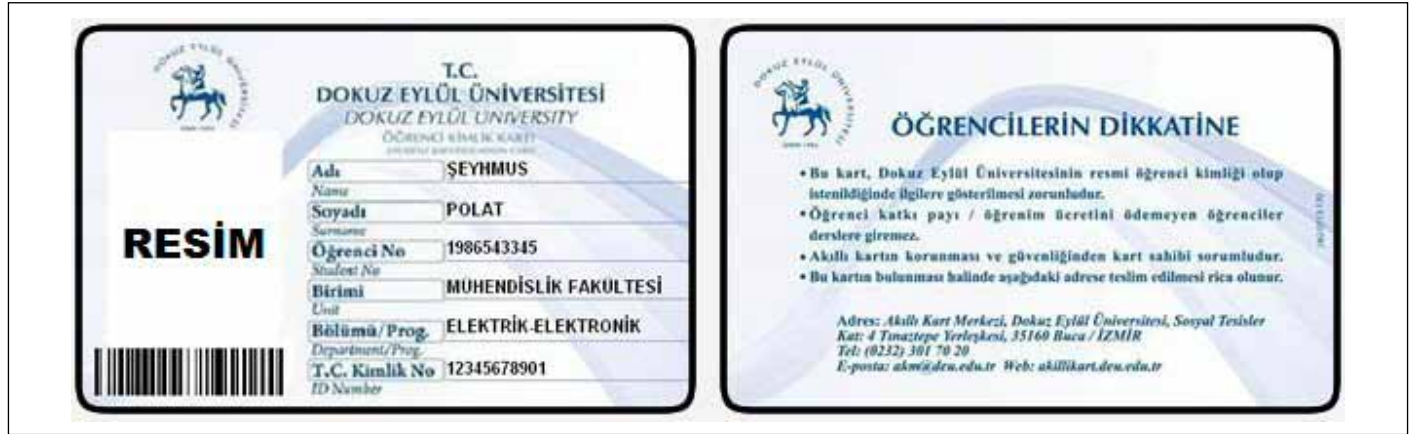
Şekil 1: Dokuz Eylül Üniversitesi öğrenci kimliği (örnektir!).