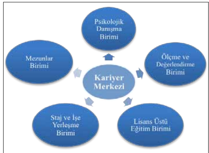
Şekil 1: Kariyer merkezi birimleri.