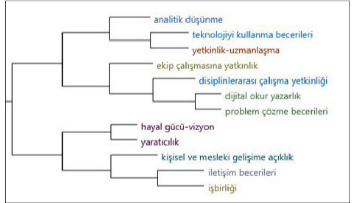
Şekil 2: Endüstri 4.0 ile işgücünün sahip olması gereken nitelikler (kelime benzerliğine göre kümelenmişlerdir).

profesyonel olacak diye de bir şey yok. Bence spesifik alanlarda uzmanların yetişmesi gerektiğini düşünüyorum.” demiştir.